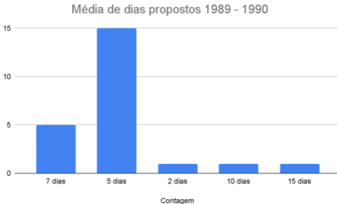
Gráfico 2: Média de dias propostos 1989-1990

Fonte: Elaborado pela autora com base nos dados coletados no site da Câmara dos Deputados