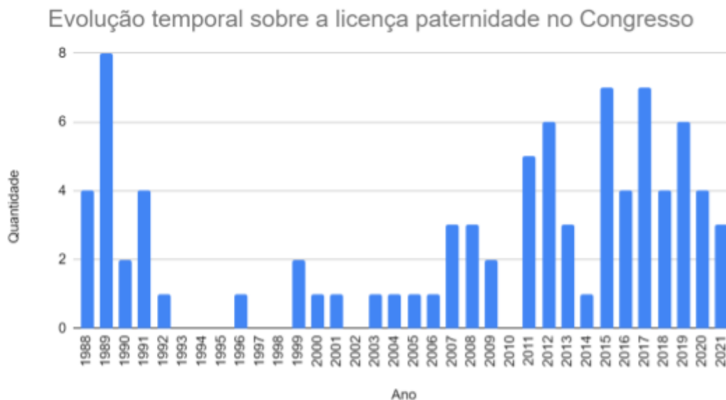
Gráfico 1: Evolução temporal sobre a licença paternidade no Congresso

elaboradas e apresentadas, com dois picos: um entre 1989 e 1990, e outro a partir de 2007.